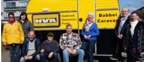
Kom naar onze Babelcaravan! p.2