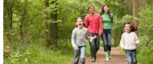
Stabroek doet je een bos cadeau p.3